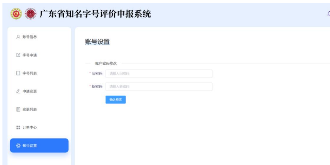
图 7 账号设置页面示例