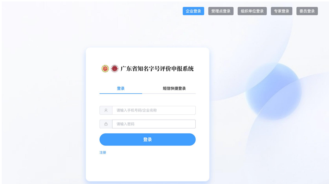
图 2 企业端登录页面示例